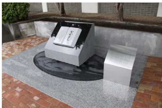
附属図書館玄関にある記念碑

文庫に配架した「少年倶楽部」「野球少年」「漫画少年」は、1920年代から1950年代にかけての少年雑誌の変遷を俯瞰する上でも貴重な資料です。また、前述の著名な漫画家のデビュー当時の作品を手にとって見ることができ、タイムスリップして彼らの将来を予感させるエスプリを感じます。