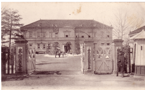
第八師団司令部（現農学生命科学部門付近）