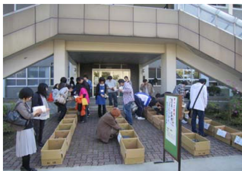
掘り出し物を求めて集う来場者

附属図書館では、第10回弘前大学総合文化祭の期間中(平成22年10月22日～24日)、附属図書館1階職員玄関前において、「知の宝！古本市～リユース・ブックフェア～」を開催しました。