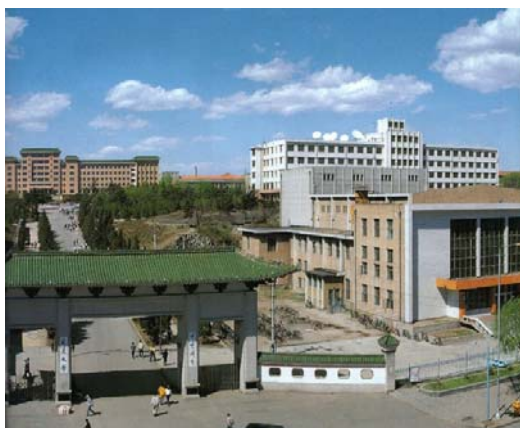
本学姉妹校の延辺大学（吉林省延吉市）

私は8年前にロシアのハバロフスクからアムール河を渡ってハルピンまで中国東北地方の満州を旅行しましたが、今年の夏は本学と姉妹校となっている延辺大学の延吉市から中国東北部の旅をし