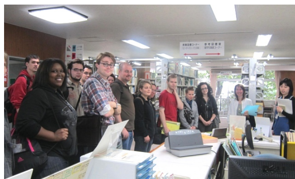
ガイダンスに参加した留学生の皆さん

2回目となる今回のガイダンスには、10月入学の協定校からの交換留学生等11カ国38名が参加しました。使用言語ごとに3回に分けて行い、国際交流センター教員と外国人留学生に通訳をしてもらいました。マルチメディアコーナーや、留学生用コーナー等の館内案内と、本の貸出・返却の仕方等について50分程度説明しました。留学生は、本の借り方等について熱心に聞いていました。