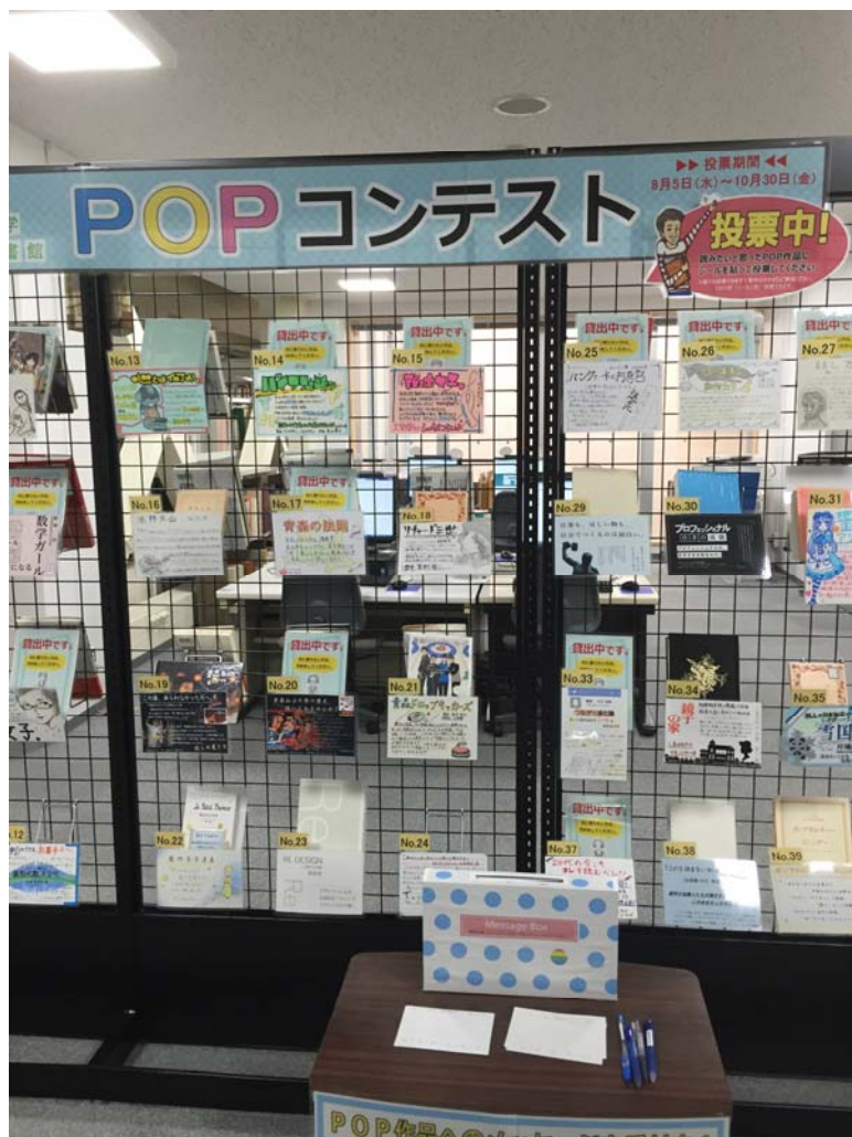
POPコンテスト展示の様子