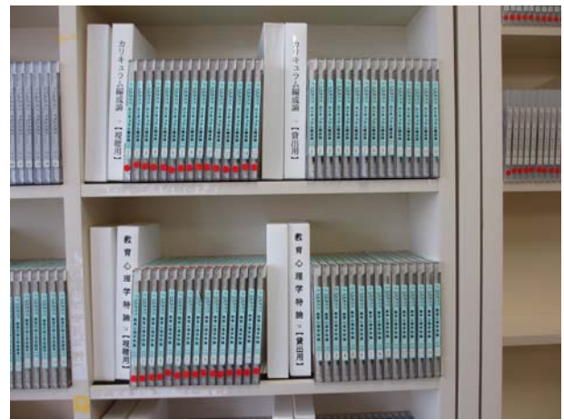
講義が収録されたDVD